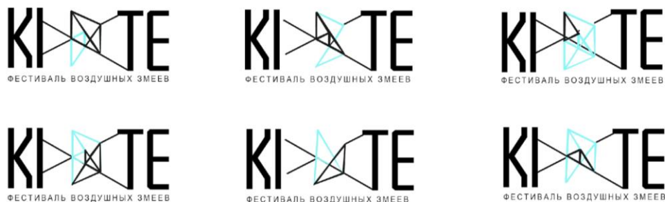
Рис. 1. Раскадровка динамического логотипа для Фестиваля воздушных змеев

Проект Лю Цань, который она выполняла в период пандемии, находясь в Китае, имел целью показать информационное сопровождение традиционного китайского праздника в современной коммуникативной среде, которая предполагала пользователей проекта, говорящих на русском и английском языках. Разработка динамического логотипа, который иллюстрирует процесс складывания воздушного змея, выполнен с помощью анимации. В нём зашифровано смысловое послание — древнее искусство создания воздушных змеев по-прежнему актуально, технологично, развиваемо (рис. 1).