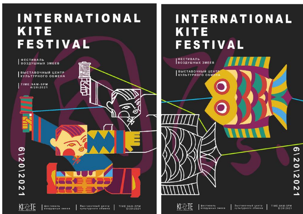
Рис. 2. Рекламные плакаты к фестивалю

Серия плакатов, разработанная для фестиваля (рис. 2), использует приём перехода графического мотива, развивающегося по горизонтали. Мы видим героя, запускающего змея, который «бежит» из плаката в плакат. Автор создаёт эффект непрерывного движения даже в статичных объектах. Этот же приём органично входит в мультимедиа инсталляцию (рис. 3), которая проецируется в большом формате в среде города.