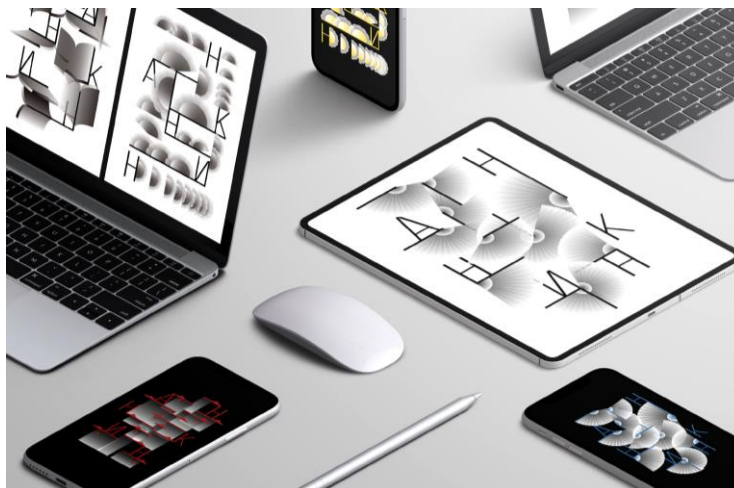
Рис. 8. Разнообразие способов донесения информации до целевой аудитории

Благодаря многолетней работе с иностранными студентами, появилось много гибридных способов коммуникации между преподавателем и студентом. Используются такие ресурсы как: презентация, короткие анимационные ролики, аудиодорожки, видеоконтент. Это продиктовано не только необходимостью установить коммуникацию между представителями разных культур и поколений, но и общей цифровизацией общества (рис. 8). Неудивительно, что эти формы общения используются и в проектных работах студентов из Китая, помогая им налаживать коммуникацию с целевой аудиторией проекта. Необходимость найти общий язык с иноязычной целевой аудиторией даёт мультимедиа ресурсам шанс проявить себя наиболее эффективно.