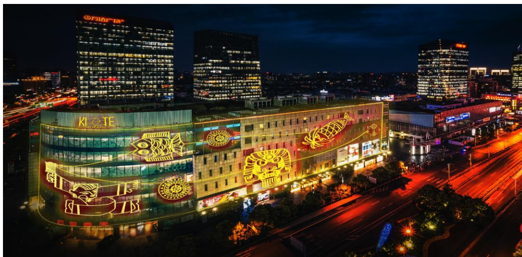
Рис. 3. Мультимедиа инсталляция

Наряду с подачей материала в современном графическом формате для широкой аудитории проекта с целью его популяризации, применяются и традиционные способы. Донесение китайских традиций хорошо проявляется в дизайне сувениров: это и закладки для книг с мотивами графики проекта, и складные уменьшенные конструкции самых узнаваемых змеев (рис. 4).