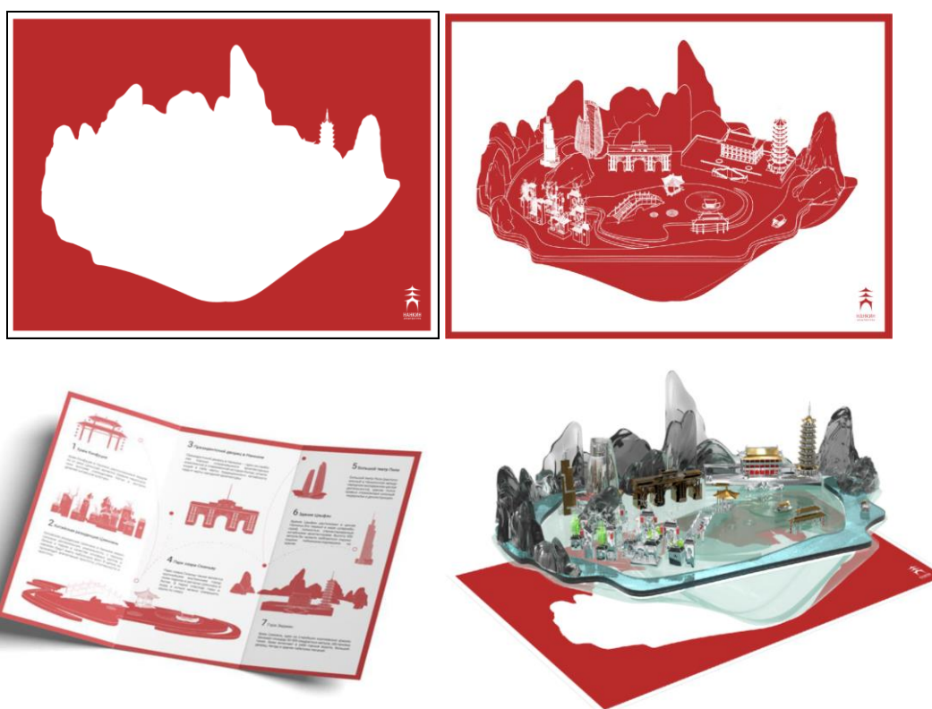
Рис. 7. Путеводитель с дополненной реальностью

Виртуальное знакомство с Нанкином должно было вдохновить путешественника на реальную поездку, как только это стало бы возможным.