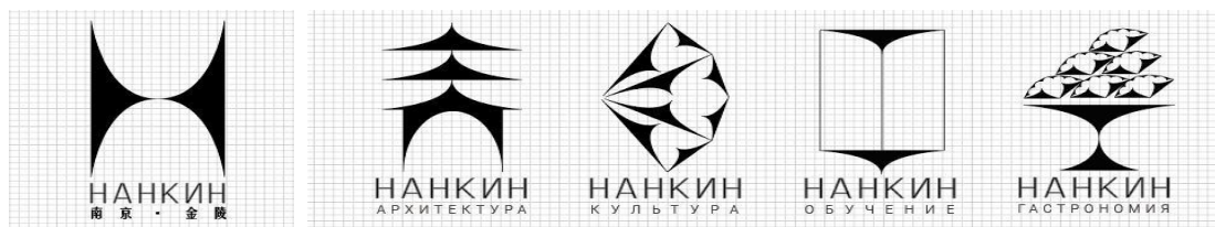
Рис. 5. Логотипный блок и дополнительные знаки проекта

Логотипный блок и дополнительные знаки проекта (рис. 5) разрабатывались как динамичные. Эту динамику можно увидеть и в статичной версии, и в анимации. Пластическая идея изменения знака заключается в том, что из одного элемента выстраивается всё разнообразие группы знаков. Это визуальное сообщение о том, что всё органично и взаимосвязано в путешествии, которое ожидает туриста, становится основой проектной концепции.