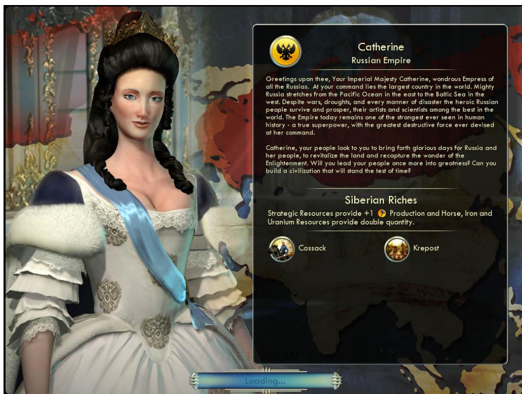
Рис. 6. Екатерина II, персонаж игры «Sid Meier's Civilization IV»

национальными особенностями и клишированным мышлением. Цель игрока — развить выбранную цивилизацию. Главные персонажи игры — реальные исторические личности. Их характер и поведение в игре максимально приближены к реальным прототипам. Русские лидеры представлены в лице Екатерины Великой (в IV и V частях) (рис. 6) и Петра Первого (в IV и VI частях) (рис. 7).