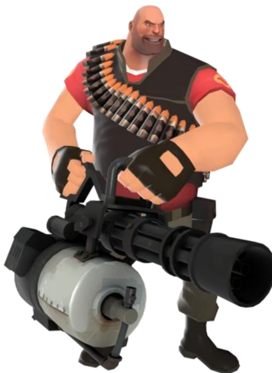
Рис. 3. Heavy, персонаж игры «Team Fortress 2»

Другой «клюквенный» образ — это Михаил или Миша (Heavy — от англ. тяжелый) из «Team Fortress 2» (Valve, 2007) (рис. 3). Даже сами разработчики сравнивают персонажа с сонным медведем, который без проблем разорвет тебя на части, если захочет. Он движется медленно, но расчетливо, и, как и Зангиев, принадлежит к граплер-типу. Он ходит по карте с огромным пулеметом наперевес и имеет большую мускулатуру. Исходя из внешнего облика, можно сказать, что персонаж не отличается большими умственными способностями.