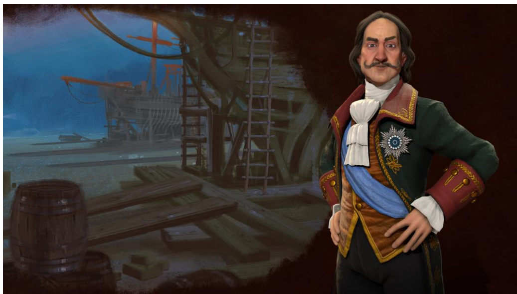
Рис. 7. Петр I, персонаж игры «Sid Meier's Civilization VI»

Внешний облик русской императрицы не соответствует привычному ее изображению на большинстве известных портретов. Если на картинах она представлена немолодой статной женщиной, то в игре она молода и излишне сексуализирована. С Екатериной легко подружиться, ее нельзя назвать разжигателем конфликтов. Но если игрок начнет с ней войну, то заключить мир будет очень сложно. Не стоит атаковать, если вы не уверены в победе. Мир она примет только,