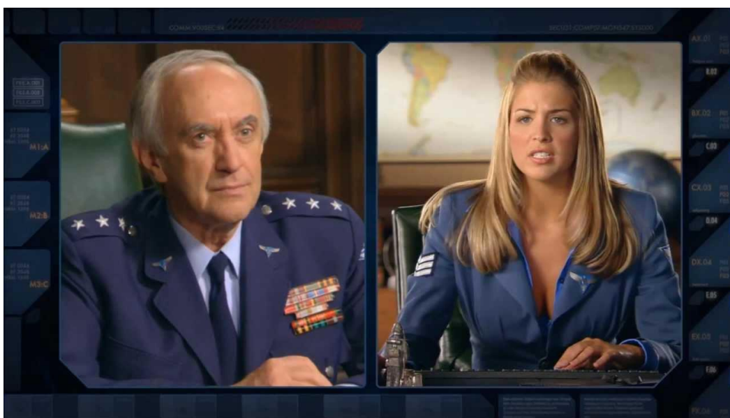
Рис. 4. Альянс, персонажи игры «Command & Conquer: Red Alert»

Иногда игры делают настолько стереотипными, что это начинает выглядеть абсурдно. Примером может служить игра «Command and Conquer: Red Alert» (Westwood Studios, 1997). Игра демонстрирует альтернативную историю применительно к периоду Второй мировой войны. Игрок может прийти к двум разным финалам: победе Альянса (рис. 4) над СССР (рис. 5) и похороненному заживо Сталину или триумфу СССР, при котором Европа лежит в руинах, а Сталин все равно погибает от рук собственной ассистентки. Игра содержит колоссальное количество штампов и клише о Советском Союзе и коммунистической идеологии в целом. Стереотипы в игре не добавляют персонажам колорита, они в игре для того, чтобы показать упрощенное изображение наций и их роль в истории.