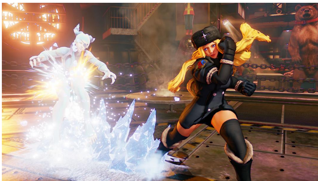
Рис. 2. Коллин, персонаж игры «Street Fighter»

Зангиевым, вынуждая думать, что русская женщина не уступает по силе мужчине и является писаной красавицей.