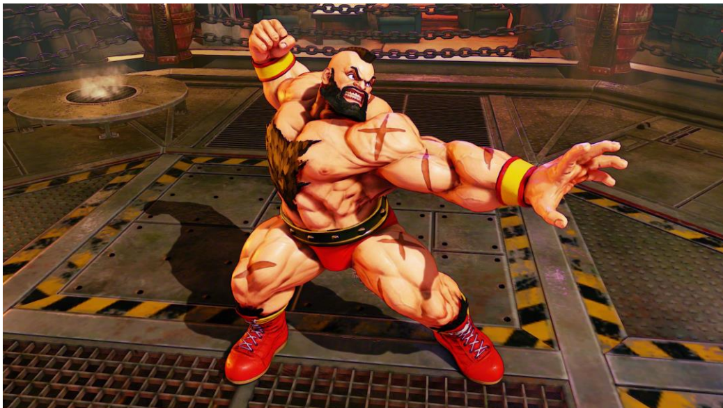
Рис. 1. Виктор Зангиев, персонаж игры «Street Fighter»

Одной из первых игр, в которой появился русский персонаж, была «Street Fighter» (Capcom, 1987). Прототипом для персонажа Зангиева (Zangief) (рис. 1), который появился еще в самой первой версии игры, — стал реальный мастер спорта СССР по вольной борьбе Виктор Зангиев. Изначально, его звали Водка Гобальски, татуированный, он носил тельняшку. Позже он оброс густой растительностью на лице и на теле, шрамами и огромной мускулатурой. Зангиев первый персонаж-граплер (от англ. grappler — более): очень сильный, но медленный. Главная мотивация персонажа для участия в боях — это противостоять Америке. Из-за железного занавеса представления о России и русских были скудными и Зангиев создал «достоверный» образ для зарубежной аудитории. В бой он идет с криками «Fog Mother Russia!». Его главная цель — борьба с коррупцией в России. Кроме игры Зангиев появляется в мультфильме Ральф (2012), где действуют более 180 популярных персонажей аркадных и компьютерных игр. Они живут своей жизнью, общаются между собой. Их характер в мультфильме отличается от предписанного игрой. И хотя в игре Зангиев имеет скорее нейтрально-отрицательную репутацию, в мультфильме «Ральф» он является членом клуба анонимных злодеев.