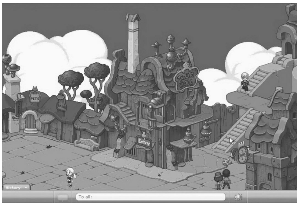
Рис. 2. Виртуальный мир «Плейдо» («Playdo»), изометрический или 2.5 D мир.

Двухмерные среды являются правилом в аватарных средах 1990-х годов (в основном в виде псевдо-3D визуализаций). Изометрические пространства (так называемые «2.5D миры») в основном распространены в виртуальных мирах для детей и молодежи (например, «Playdo», «Hotel Habbo»), в то время как трехмерные миры являются наиболее требовательной категорией с точки зрения программного космоса и технологий. Аспект перспективы зафиксирован для 2D и 2.5D миров: каждый из пользователей смотрит на поверхность, или изометрическое пространство с внешней точки зрения; они оторваны от своих аватаров тем, что не двигаются вместе с ними (с лудической точки зрения, эта перспектива очень напоминает кукольные домики; см. рис. 2).