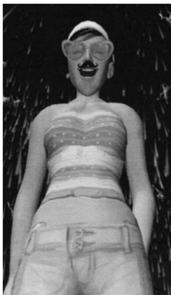
Рис. 3. Гендерные игры в «Second Life».

В этих случаях аватар часто представляет собой явно дискурсивную визуальную форму самовыражения (но не обязательно визуальной саморепрезентации), в которой нормы и идеалы тела, гендерные аспекты, субкультурные и иные исключения обговариваются перформативно (Svarog, 2007).