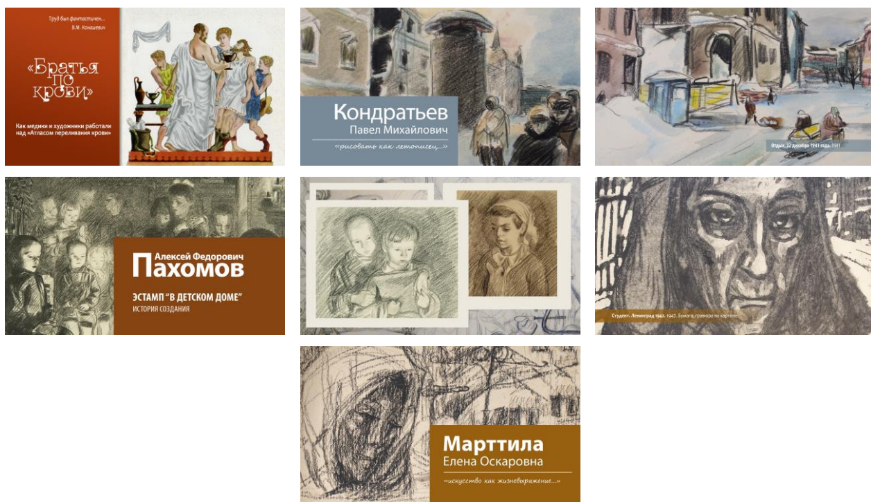
Рис. 4. Кадры из мультимедийных фильмов, подготовленных Центром мультимедиа Русского музея