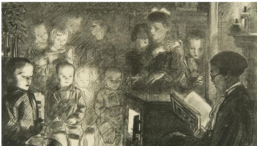
Рис. 1. Пример работы со статичным изображением в музейном фильме. Видео (URL: https://youtu.be/Mr0HlyQC0CQ )

Однако если фильм относится к искусству кинематографа, движущейся картинке, то музейный фильм ни в коем случае не должен забывать о том, что мы будем говорить о статичных изображениях, которые превратим в видео, в движущую картинку, и эту трансформацию мы должны обосновать нашим сюжетом, нашим пониманием произведения искусства — почему мы именно так «движемся» по картине, почему мы фрагментируем, и как мы сопоставляем фрагменты, и так далее (рис. 1). Конечно, в наш фильм мы, возможно, включим видео (видео по экспозиции или сцену интервью и др.), но, тем не менее, центральный фокус музейного фильма — произведение искусства, картина, графический лист, время которого замкнуто рамой, картинной плоскостью. Мы выразим свое понимание этого произведения с помощью сценария и монтажа, но доминировать должно все же САМО ПРОИЗВЕДЕНИЕ, авторский замысел его творца, то, что нам предстоит раскрыть.