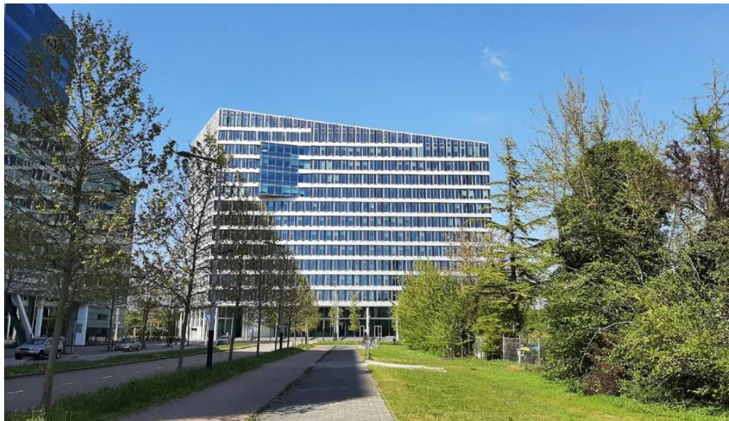
Рис. 4. Офисное здание «The Edge» в Амстердаме, Нидерланды

2. «The Crystal» здание в Лондоне, Англия, — это выставочный центр, посвященный устойчивому развитию и экологической ответственности. Здание оснащено фотоэлектрическими и солнечными панелями, в нем используются системы утилизации отходов и энергоэффективные технологии (рис. 5).