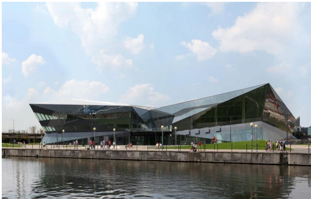
Рис. 5. Здание «The Cristal» в Лондоне, Великобритания

2. «The Crystal» здание в Лондоне, Англия, — это выставочный центр, посвященный устойчивому развитию и экологической ответственности. Здание оснащено фотоэлектрическими и солнечными панелями, в нем используются системы утилизации отходов и энергоэффективные технологии (рис. 5).