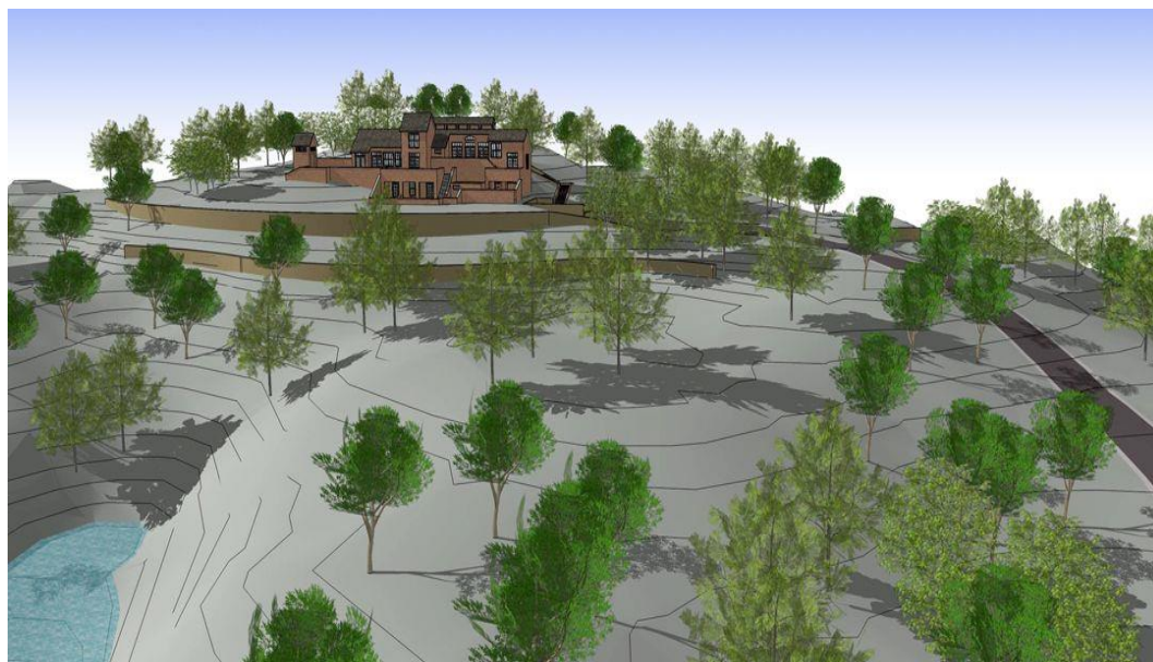
Рис. 2. Цифровая модель рельефа, рельеф местности, ландшафтный дизайн