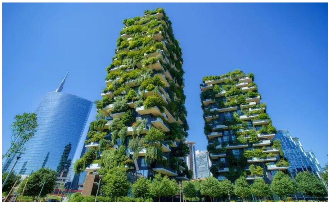
Рис. 6. «Вертикальный лес» в Милане, Италия

Эти примеры показывают, что создание качественных общественных пространств неразрывно связано с достижением экологических и социальных целей. Общественные пространства способствуют созданию устойчивых сообществ, основанных на экологических соображениях и взаимной поддержке жителей, и помогают решать проблемы, стоящие перед современными городами.